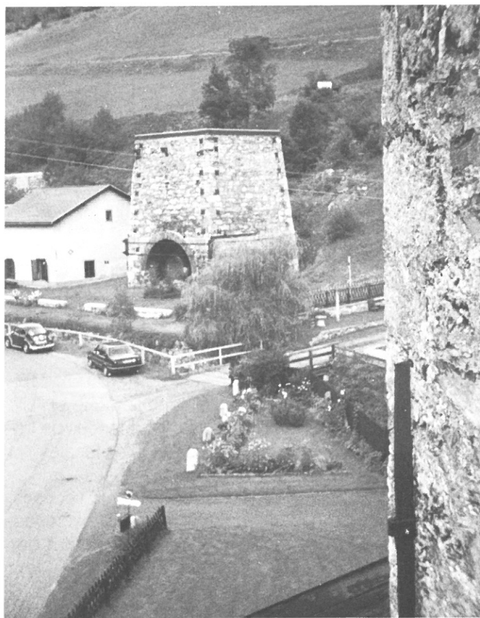
Ancien haut- fourneau de Vordernberg (19 e siècle)

L'accès du grand public ne doit pas tuer l'archéologie industrielle — tout le monde est bien d'accord là-dessus — mais, comme le disait un rapporteur anglophone: «We cannot afford purity always». D'autre part, le poids de l'opinion publique en vue d'influencer les autorités dans le sens d'une politique de conservation est essentiel dans le contexte d'une civilisation des loisirs.