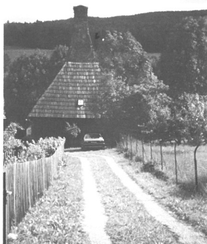
Ancien haut-fourneau d'Edlach (17 e siècle)

Après le congrès de Belgique, en 1990, il a été décidé que la périodicité sera ramenée à deux ans au lieu de trois. En 1992, le congrès aurait lieu en République Démocratique Allemande, pour commémorer le cinquième centenaire de la naissance du célèbre métallurgiste Agricola, et en 1994 au Canada.